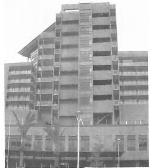
地上12階建て、高さ58・8m、648床、47診療科を構えた県内最大規模の医療機関。患者・見舞客用の駐車場は560台収容

③産業を振興し雇用を維持拡大するための取り組みの効果は、業種によって様々な背景があり、事業の効果雇用面のみで一律に評価できないものもある。それぞれの事業について事業目標の設定や雇用面に配慮した事業の選択、事業効果の検証が必要。今後とも留意しながら雇用の維持拡大に向け事業成果を着実に積み重ねていく。