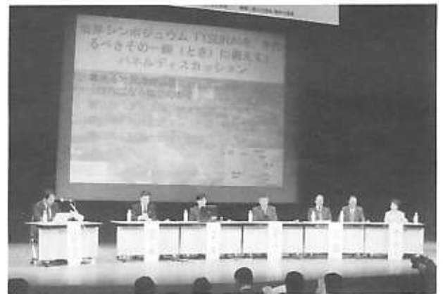
1月19日神戸市で開催された津波シンポジウムにも参加してきました。